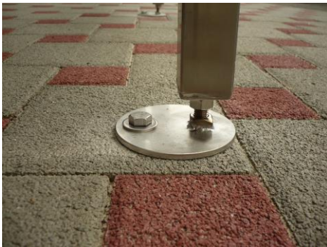
Variante I: unsichtbares Fundament

Zur sicheren Bodenbefestigung empfehlen wir vier Punktfundamente. Diese Fundamente können Sie selbst mit Fertigbeton aus dem Baumarkt oder z.B. mit Hilfe eines Garten- u. Landschaftsbauers anfertigen. Folgende Fundamentformen sind möglich (bitte Variante bei Bestellung angeben):